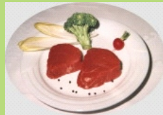
Filetsteak ( 1 x 2 Stück )