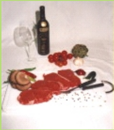
Rumpsteak ( 2 x 2 Stück )