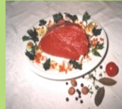
Braten (auch für Geschnetzeltes ) (cirka 3 x 750g )