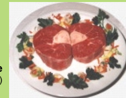
Beinscheibe ( 1 x groß oder 2 x klein )