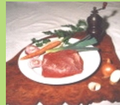
Suppenfleisch durchwachsen und mager ( cirka 4 x 350g )