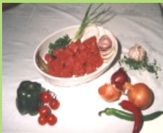
Gulasch ( 3 x ca. 500g )