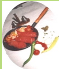
Rouladen ( 2 x 2 Stück )