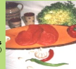
Weide – Steaks ( cirka 2 x 2 Stück )